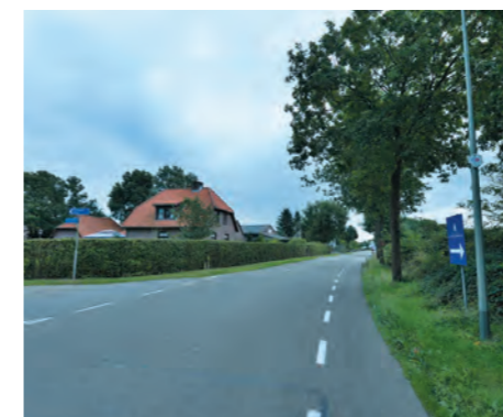
Het aanpassen van de T-splitsing Kampweg-De Vissert is een van de eerste maatregelen die de gemeente neemt om de overlast van recreatief verkeer door de Sterrenbos in Well te voorkomen.

Eén wand van zijn kamer in het gemeentehuis wordt bijna geheel in beslag genomen door een gedetailleerde kaart van het gebied. Tijdens ons gesprek springt de wethouder regelmatig van zijn stoel om iets aan te wijzen of te duiden. "Het gebied tussen Maas en de grens met Duitsland is voor mij het allermooiste stukje Nederland. Wij dragen de verantwoordelijkheid om het mooi te houden," verklaart hij.