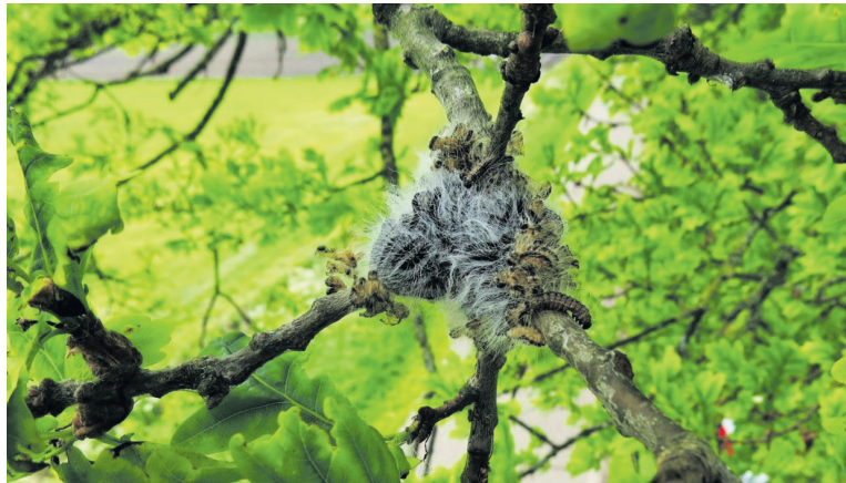
Eikenprocessierups met brandharen

Uit de evaluatie bleek dat de aanpak van voorgaande jaren niet zorgt voor een structurele afname van processierupsen. Door preventief bestrijden was de overlast op sommige locaties wel minder. Het bestrijden en/of verwijderen van het steeds toenemend aantal nesten was en is, mede gelet op de toenemende